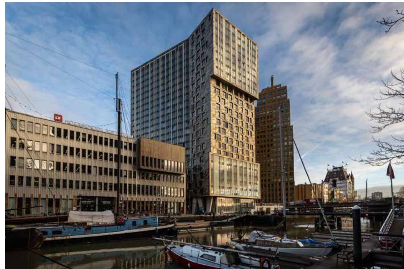
OurDomain Rotterdam.

Ook voor de bouw van distributiecentra is Intal de ideale bouwpartner. Dat blijkt wel uit de duurzame samenwerking met partijen als Vrolijk, ASK Romein,