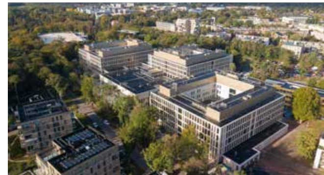
Tergooi MC Hilversum.