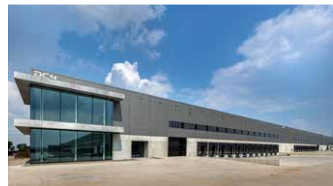
Smartlog 3 Moerdijk.

Remmers Bouwgroep, VDR Groep en Goldbeck, waarmee Intal inmiddels tientallen distributiecentra heeft gerealiseerd. "Doordat onze routes in het gehele proces al vast liggen en het gehele productieproces onder één dak plaatsvindt, kunnen we snelle levering van kwalitatief hoogwaardige producten garanderen", zegt Andringa