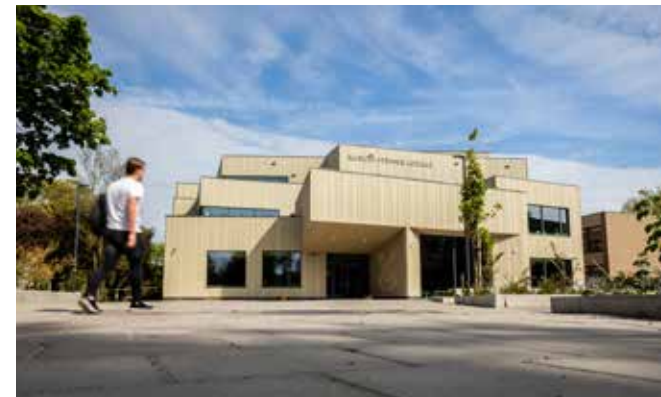
Rudolf Steiner College Rotterdam. (Beeld: Sebastiaan Rozendaal)