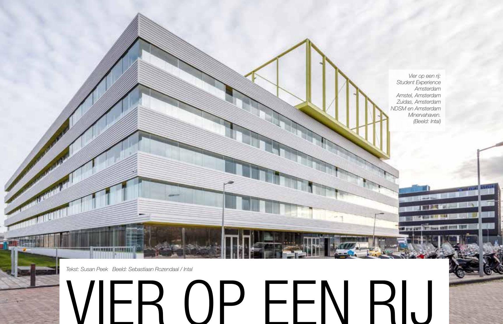
Vier op een rij: Student Experience Amsterdam Amstel, Amsterdam Zuidas, Amsterdam NDSM en Amsterdam Minervahaven.

Tekst: Susan Peek