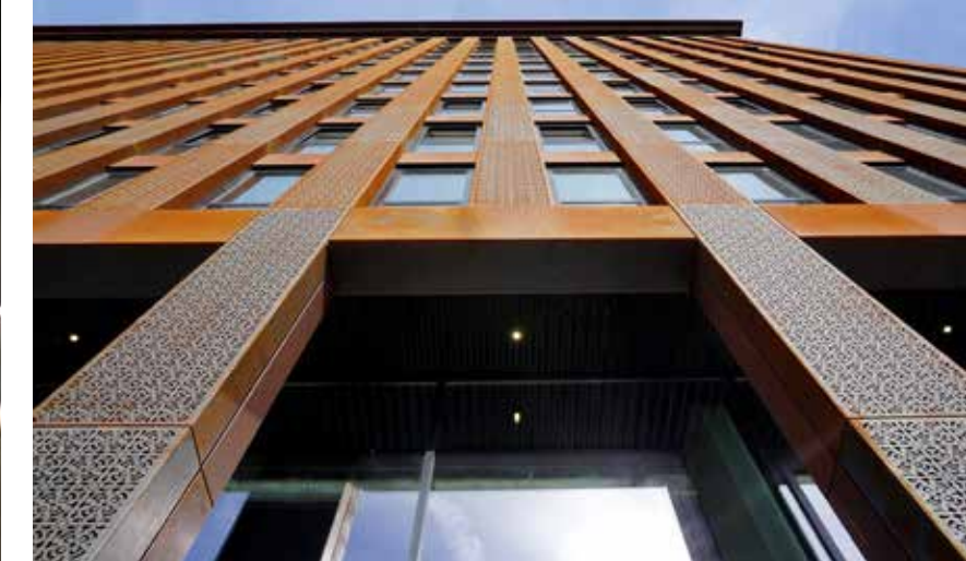
De entree en raampartijen bij Student Experience Amsterdam NDSM geven het gebouw een unieke uitstraling.

De vier studentcomplexen van Student Experience International Amsterdam (SEI Amsterdam) zijn gerealiseerd in opdracht van de onafhankelijke, zelfstandig opererende vastgoedontwikkelaar en -beheerder Student Experience. Bij de studentcomplexen staan beleving, service, gastvrijheid en sfeer centraal. Studenten wonen op zichzelf in moderne locaties voorzien van kitchenette, waarnaast ze diverse gemeenschappelijke faciliteiten tot hun beschikking hebben zodat het sociale aspect nooit ver weg is. Denk daarbij aan een lounge, game corner, private dining, studieruimtes, fitnessruimte, wasserette, binnentuin en sportveld op het dak.