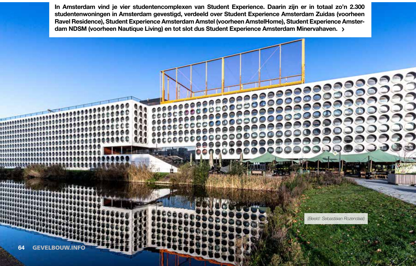
(Beeld: Sebastiaan Rozendaal)